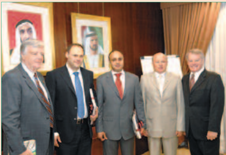
Зустріч з керівництвом Зайєд-Шейх університету (м. Дубай).

виться потужною науково-дослідною базою та консалтинговою діяльністю, в якій беруть участь професори з різних країн світу, у тому числі США, Великобританії, Франції, Швейцарії та ін.