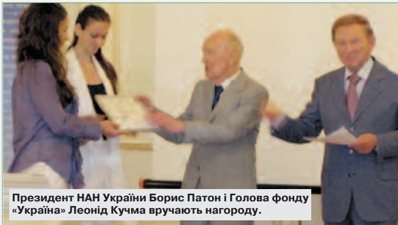
Президент НАН України Борис Патон і Голова фонду «Україна» Леонід Кучма вручають нагороду.

кафедри міжнародної економіки Ірина Зарицька з роботою на тему "Перерозподіл фінансових шоків в економіці в умовах глобальної фінансово-економічної кризи: світовий досвід та особливості мінімізації негативних наслідків для України".