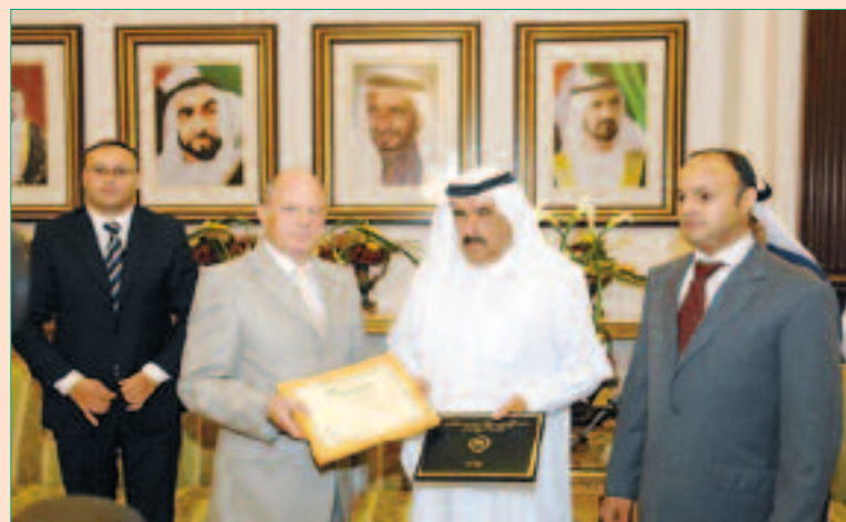
Вручення Шейху Хамдану бін Рашиду Аль Мактуму диплому почесного доктора КНЕУ.

Шейх висловив щире вдячність за нагороду і своє бажання здійснити візит в Україну, насамперед, у наш університет. Під його патронатом були встановлені ділові контакти з Зайєд-Шейх університетом (м. Дубай), який на сьогодні сла-