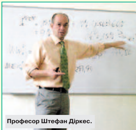
Професор Штефан Діркес.

У рамках реалізації Угоди про співробітництво у галузі освіти та науки між КНЕУ та Філіппс-Університетом (м. Марбург, Німеччина) з 21 по 24 вересня для студентів магістерської програми "Фінансовий контролінг" (ФЕФ) було проведено цикл лекцій "Business evaluation and value based management" (Оцінка бізнесу і вартісно-орієнтований менеджмент). Проведений захід є складовою започаткованої в КНЕУ спільної українсько-німецької програми підготовки магістрів з фінансового контролінгу, яка передбачає викладання німецькими партнерами окремих дисциплін, спільні наукові дослідження, а також навчання українських студентів у Марбурзі. Курс лекцій був проведений деканом економічного факультету Філіппс-Університету, професором Штефаном Діркесом на запрошення керівника магістерської програми „Фінансовий контролінг” професора О.О. Терещенка.