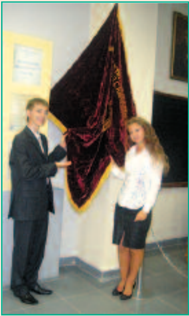
Поганий той солдат, який не мріє стати генералом, так само, як і той школяр, котрий не мріє стати студентом престижного вишу. Ще з дев'ятого класу я мріяла про