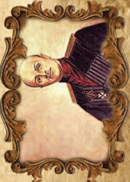
Павло Скоропадський Гетьман України (1918)