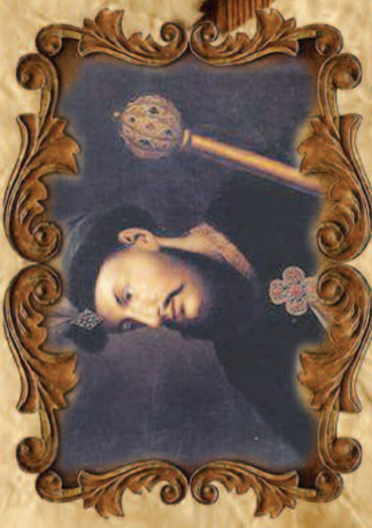
Пилип Орлик Гетьман України (у вигнанні) (1710-1742)