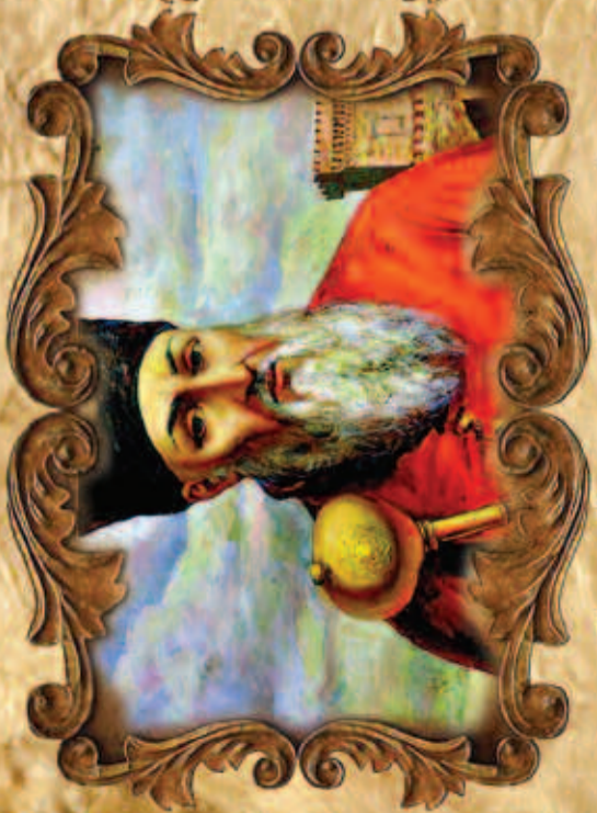
Петро Конашевич-Сагайдачний Гетьман Війська Запорозького (1606-1622 з перервами)