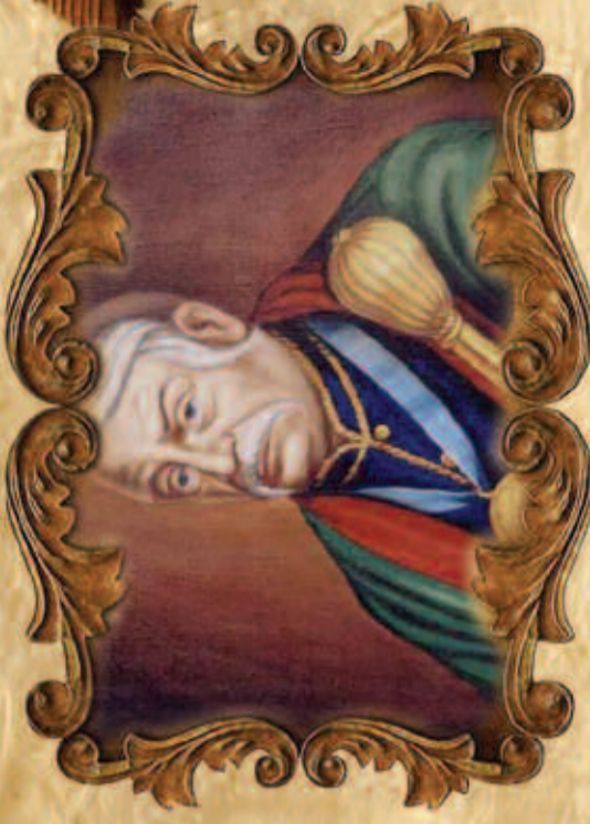
Петро Калнишевський Кошовий отаман Запорозької Счі (1765-1775)