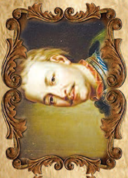
Іван Мазепа Гетьман України (1687-1709)