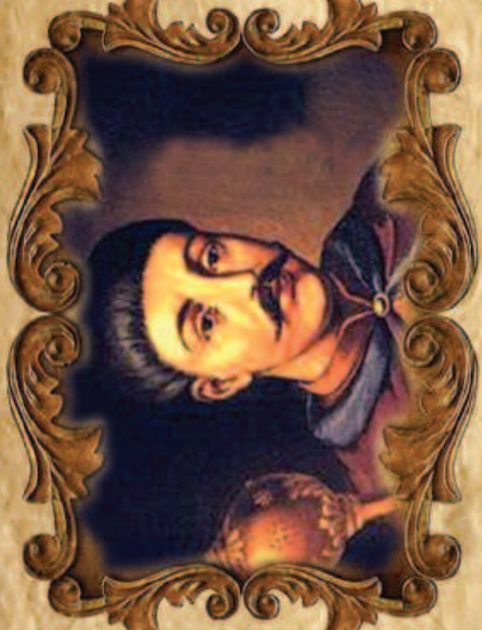
Іван Брюховецький Гетьман Війська Запорозького (1663-1668)