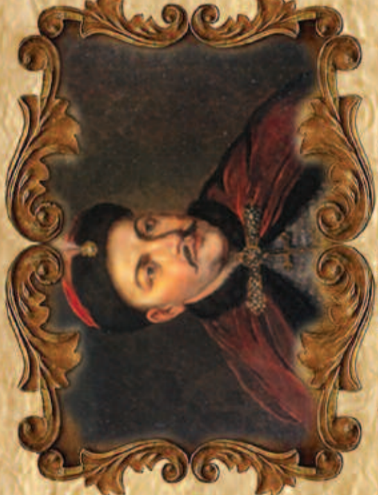
Юрій Хмельницький Гетьман Війська Запорозького (1657, 1659-1663)