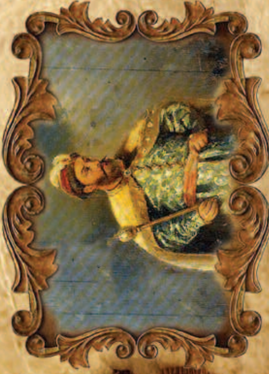
Михайло Дорошенко Гетьман України (1622-1628 з перервами)