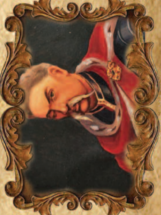
Іван Скоропадський Гетьман Війська Запорозького (1708-1722)