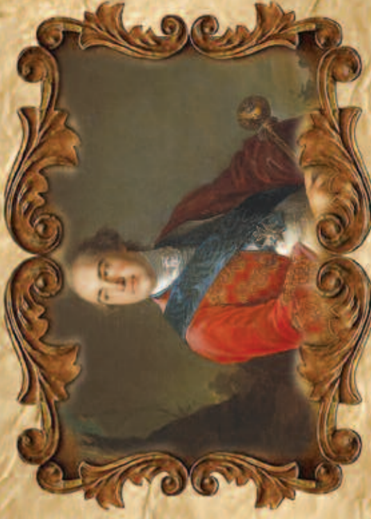
Кирило Розумовський Гетьман України (1750-1764)