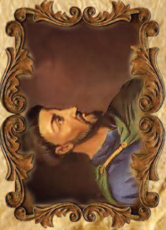
Демян Многогрішний Гетьман Лівобережної України (1669-1672)