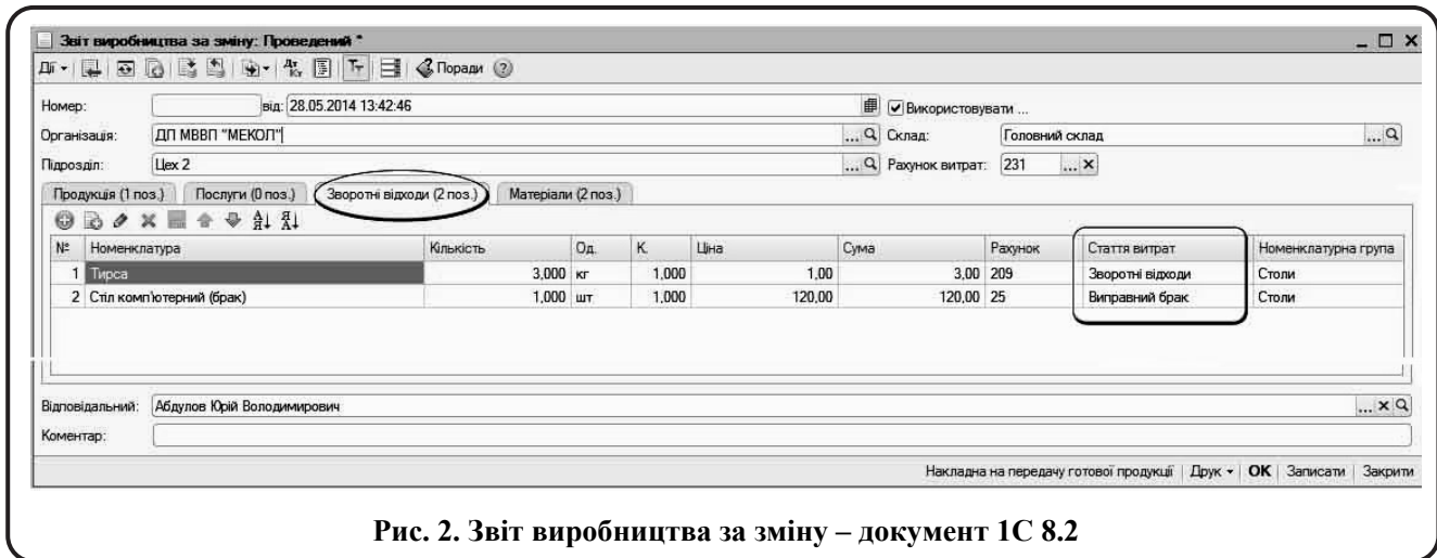
Рис. 2. Звіт виробництва за зміну – документ 1С 8.2

продукті 1С 8.2 в бухгалтерському інтерфейсі для обліку зворотних відходів створюється документ «Звіт виробництва за зміну», виконуємо наступні дії: Меню – Виробництво – Звіт виробництва за зміну (рис. 2).