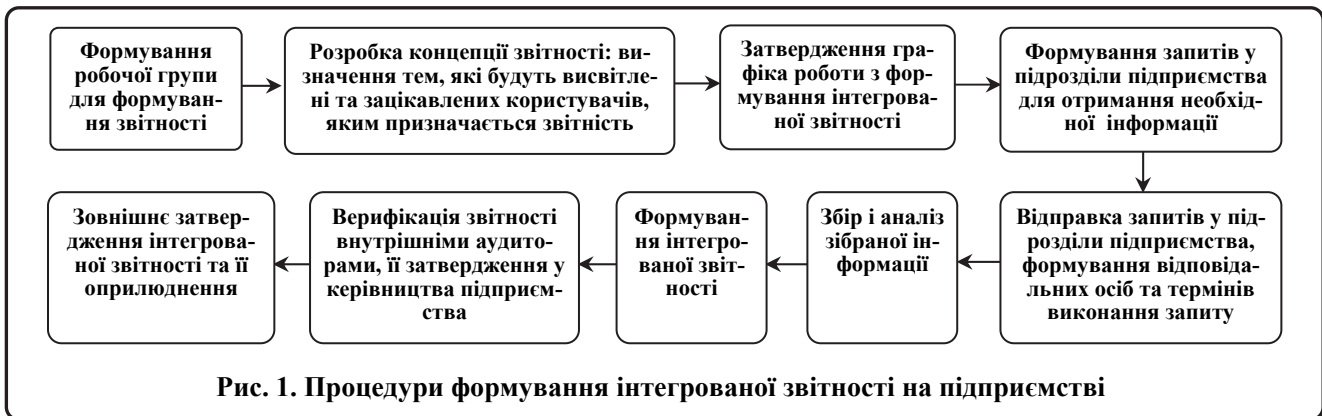
Рис. 1. Процедури формування інтегрованої звітності на підприємстві

На кожному етапі процедури формування інтегрованого звіту (рис. 1) мають бути чітко визначені наступні елементи: 1) необхідні дані; 2) відповідальні особи; 3) строки виконання.