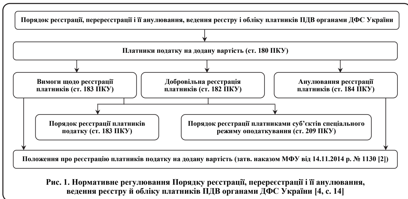
Рис. 1. Нормативне регулювання Порядку реєстрації, перереєстрації і її анулювання, ведення реєстру й обліку платників ПДВ органами ДФС України [4, с. 14]

Згідно з пп. 14.1.60 п. 14.1 ст. 14 ПКУ ЄРПН – реєстр відомостей щодо податкових накладних та розрахунків коригування, який ведеться центральним органом виконавчої влади, що забезпечує формування та реалізує, державну податкову і митну політику, в електронному вигляді згідно з наданими платниками податку на додану вартість електронними документами [1].