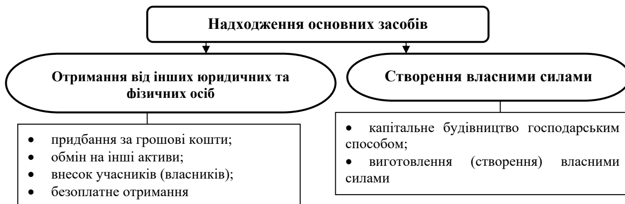
Рис. 2.1. Шляхи надходження основних засобів на підприємство

на підприємство, зумовлено можливими різноманітними шляхами їх надходження (рис. 2.1).