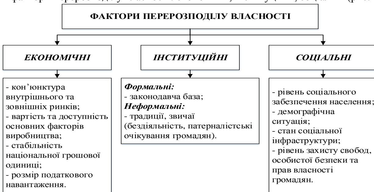
Рис. 1. Фактори перерозподілу власності*

У роботі розкрито чітку специфікацію прав власності, яка виступає об'єктивною необхідністю для зменшення трансакційних витрат. Не випадково неінституціоналісти розглядають специфікацію прав власності (уточнення пучків прав власності), інструменти і гарантії, що сприяють її досягненню, найважливішою детермінантою ефективного функціонування економіки. У цьому контексті автором, із позицій інституціоналізму, до методології аналізу розвитку відносин власності запропоновано включати не лише економічні відносини, а й соціальні, політичні, правові, етичні, психологічні, національні, духовні тощо. На цій основі виділено основні фактори перерозподілу власності: економічні, інституційні, соціальні (рис.1).