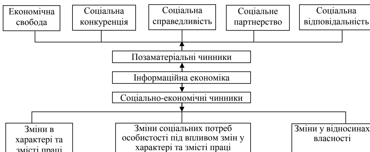
Рис. 3. Система мотиваційних чинників в економіці інформаційного типу

У роботі наведено систему мотиваційних чинників, що сприяють реалізації цілей економічної політики в умовах формування економіки інформаційного типу. Визначені чинники проаналізовано з точки зору їх впливу на формування економіки інформаційного типу та проблемності даного процесу. Створення належного мотиваційного механізму як пріоритету у формуванні економіки інформаційного типу має стати основою для формування національної стратегії розбудови даної економічної моделі, оскільки саме мотивація є передумовою для активного включення суспільства, бізнесу, окремого фахівця в процесі розвитку нового типу економічних відносин. Також було встановлено, що однією з основних характеристик інформаційної економіки є одночасне утворення позаматеріальних чинників мотивації та нових соціально-економічних чинників мотивації (рис. 3).