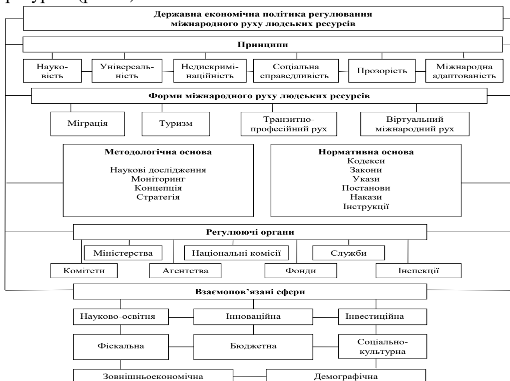
Рис. 3. Регулювання міжнародного руху людських ресурсів України*

Ідентифікація сучасних проблем та майбутніх викликів глобальної інтелектуалізації у національній економіці України дала можливість концептуалізації державної економічної політики регулювання міжнародного руху людських ресурсів (рис. 3).