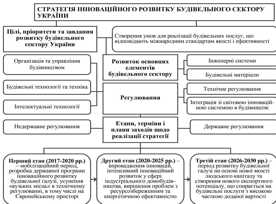
Рис. 3. Стратегії інноваційного розвитку будівельного сектору України

країн. У дисертації виявлені характерні риси кластерів країн за розвитком ринку будівельних послуг (що здійснено за допомогою інструментарію SWOT-аналізу), а також з'ясовані резерви інноваційного розвитку будівельної індустрії України. Виявлено фактори, які перешкоджають ефективному функціонуванню інноваційної системи у будівельній індустрії, а саме: неефективна стандартизація й ліцензування, відсутність державної політики стимулювання, невисокий платоспроможний попит, зменшення джерел фінансування, низька продуктивність праці, що зумовлюють зниження конкурентоспроможності будівельних послуг України на європейському ринку. Більшість зазначених факторів є взаємозалежними й посилюють основні системні проблеми сектору: низький рівень інвестиційної привабливості, технологічна відсталість, відсутність єдиної системи інформаційно-програмного забезпечення будівництва, формування вартості об'єктів будівництва, низький рівень кваліфікації кадрів.