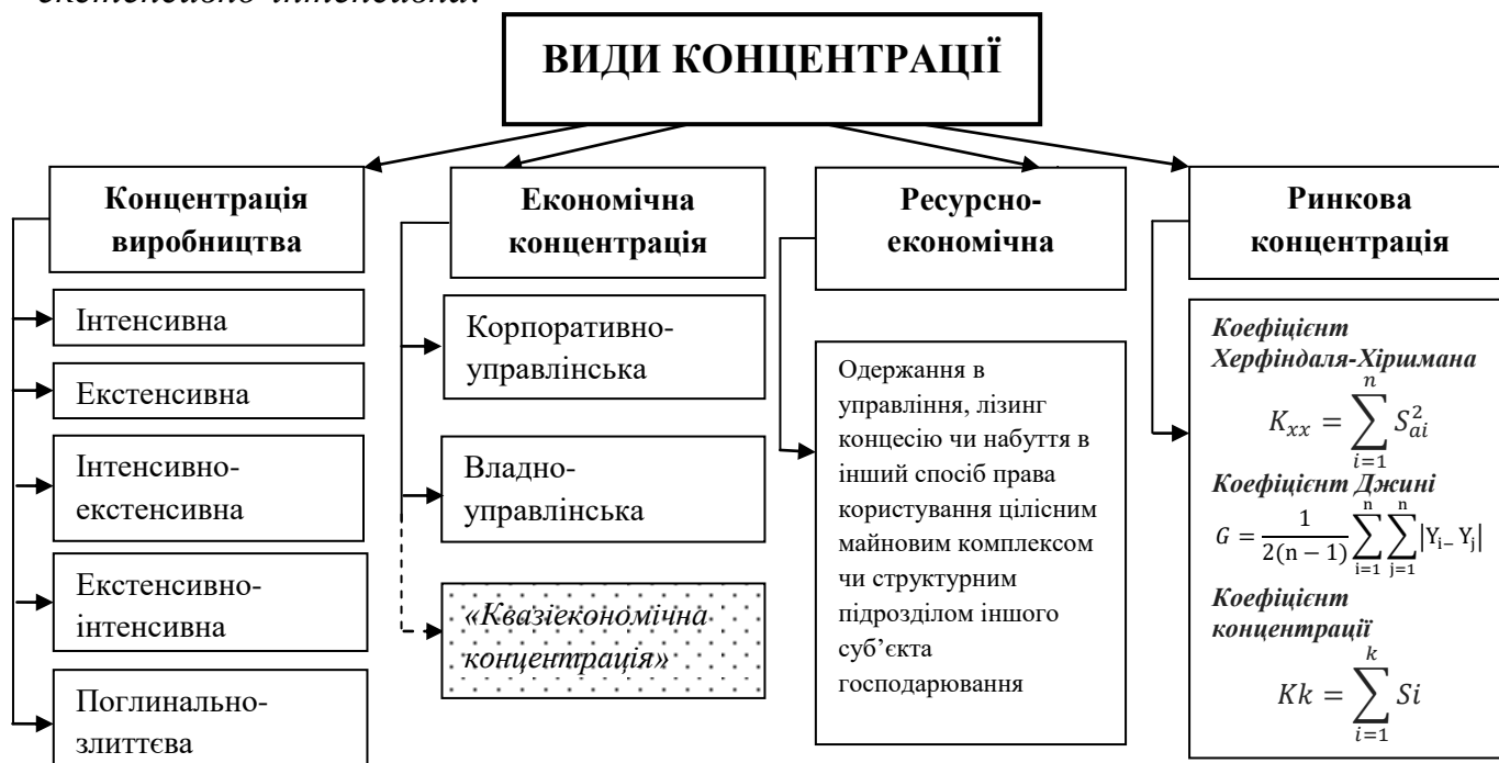
Рис.1. Види і форми концентрації виробництва

підрозділів інших підприємств, а також коли воно придбає активи суб'єктів господарювання, що ліквідуються. За способом виникнення поглинально-злиттєва форма концентрації може мати два різновиди – інтенсивно-екстенсивна і екстенсивно-інтенсивна .