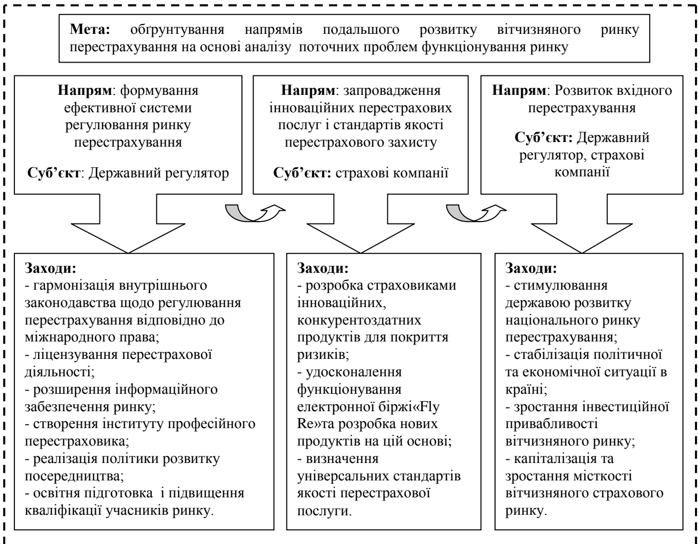
Рис. 2. Комплекс взаємопов'язаних заходів щодо поетапної розбудови ринку перестраховання в Україні

Визначення напрямів розвитку вітчизняного ринку перестраховання і розробка за кожним з них відповідних заходів реформування, на думку автора, сприятиме розбудові в країні прозорого і конкурентоздатного перестрахового ринку. Основні положення запропонованого комплексу заходів деталізовано і унаочнено на рис. 2.