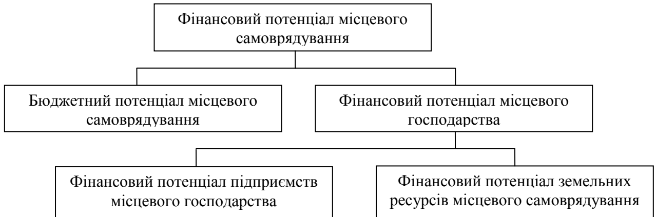
Рис. 1. Склад фінансового потенціалу місцевого самоврядування*

потенціал місцевого господарства. При цьому фінансовий потенціал місцевого господарства включає фінансовий потенціал підприємств місцевого господарства та фінансовий потенціал земельних ресурсів місцевого самоврядування (рис.1.).