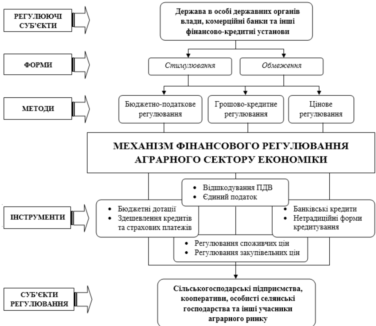
Рис.1. Механізм фінансового регулювання аграрного сектору економіки

Доведено, що для досягнення максимального стимулюючого ефекту необхідна комплексна та ефективна взаємодія усіх складових механізму фінансового регулювання аграрного сектору економіки України, структурна будова якого представлена на рис. 1.