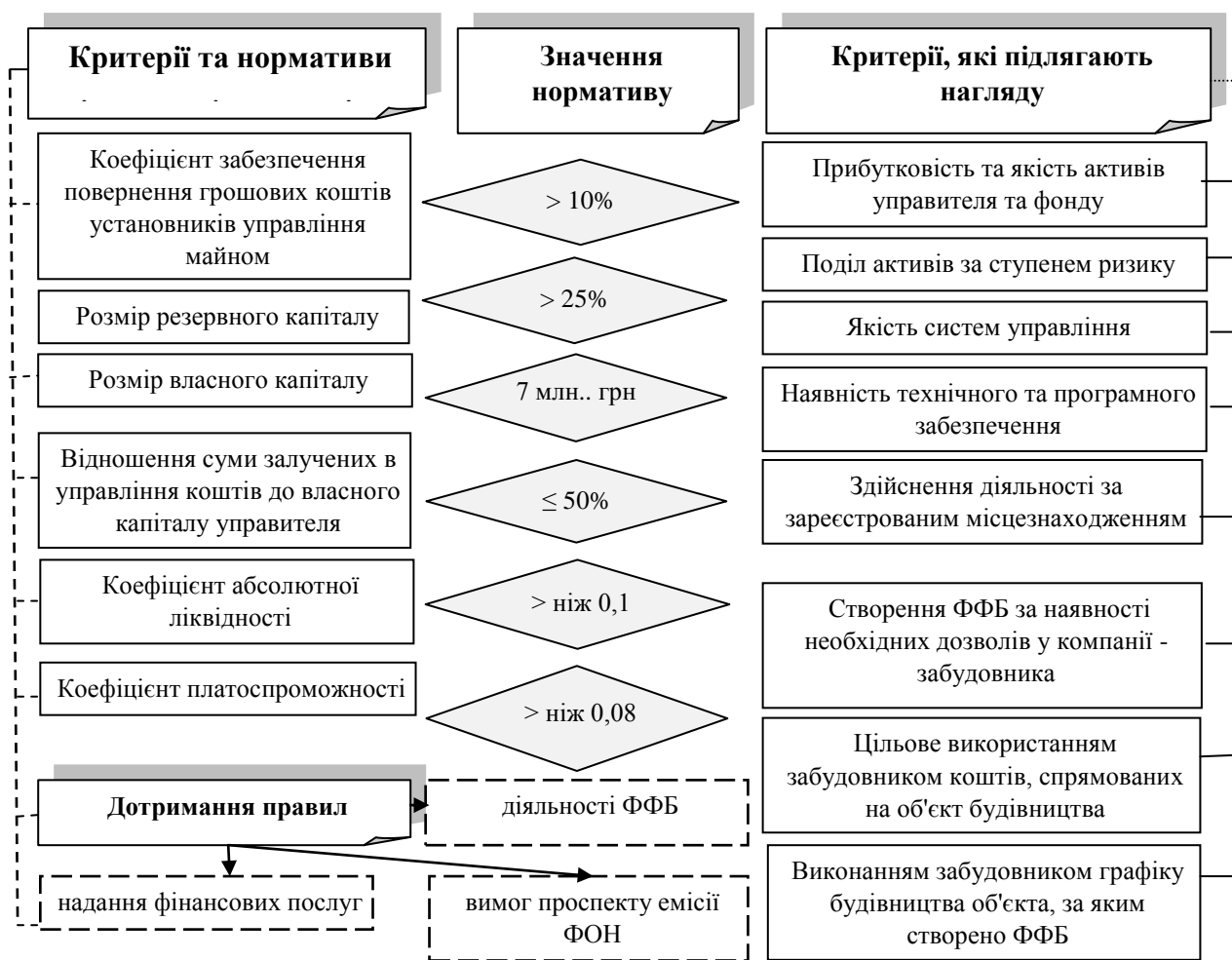
Рис. 2. Критерії та нормативи діяльності компаній-управителів ФФБ