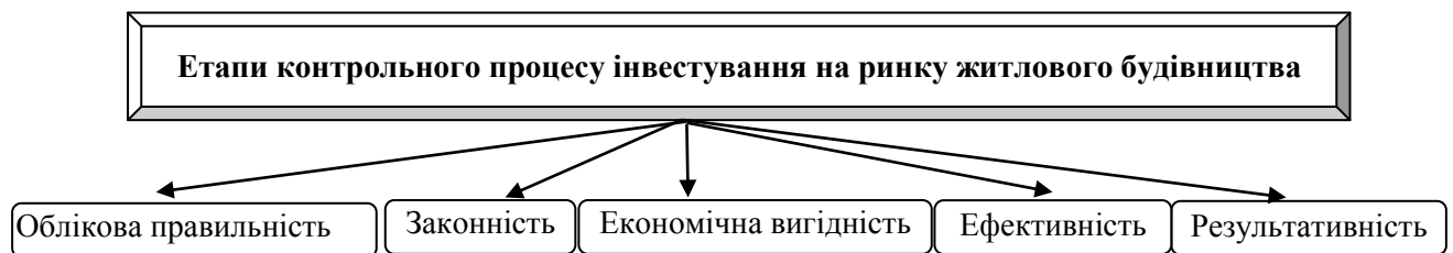
Рис.1. Етапи контрольного процесу інвестування на ринку житлового будівництва

Аналіз методів фінансового контролю інвестування житлового будівництва свідчить, що домінуючими є моніторинг та нагляд, які здійснюючи специфічні інформаційно-аналітичні дії, підвищують рівень інтелектуалізації системи фінансового контролю держави та спрямовані на процесуальні характеристики фінансових операцій, фіксацію проміжних результатів, чітку інтерпретацію особливостей функціонування інструментів інвестування у житлове будівництво, що дає змогу відслідковувати як фактичні, так і потенційні критичні події та приймати оперативні рішення. Аналіз автором мети використання такої форми фінансового контролю як аудит свідчить про її дискусійний характер, оскільки у вітчизняних умовах його суспільно корисна функція (підтвердження достовірності фінансових звітів і виявлення сумнівних фінансових операцій) є вторинною, а надання платних послуг в якості засобу підприємницької діяльності для задоволення бізнесових потреб – основною, що призводить до інваріантності висновків різних аудиторів щодо одних і тих же інструментів інвестування. Проведене дослідження свідчить, що використання вищезначених форм та методів проведення контрольних дій призводить до досягнення лише третього етапу схеми фінансового контролю (рис. 1).