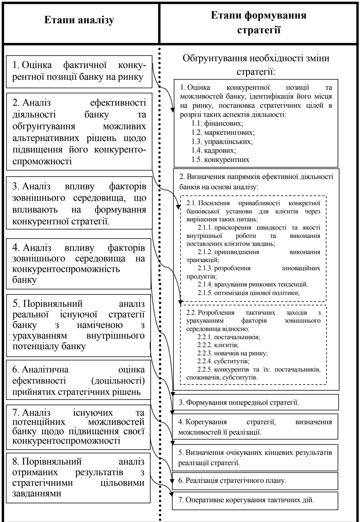
Рис. 1. Взаємозв'язок етапів стратегічного аналізу конкурентоспроможності банку та формування стратегії його розвитку (розробка автора)