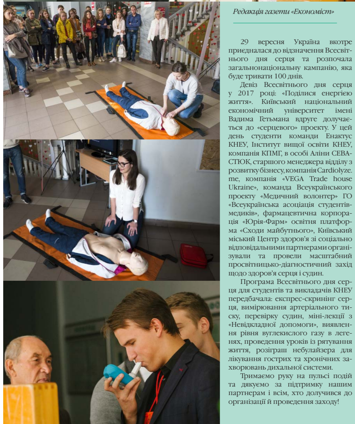
Редакція газети «Економіст»

29 вересня Україна ввотре приєдналася до відзначення Всесвітнього дня серця та розпочала загальнонаціональну кампанію, яка буде тривати 100 днів.