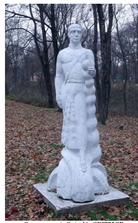
Скульптор Сергій СЫБНУВ 2007 р.

Дослідивши зібрану колекцію, ми з'ясували, що пам'ятників СКОВОРОДИ, крім встановлених на територіях трьох меморіальних музеїв, знаходяться й у