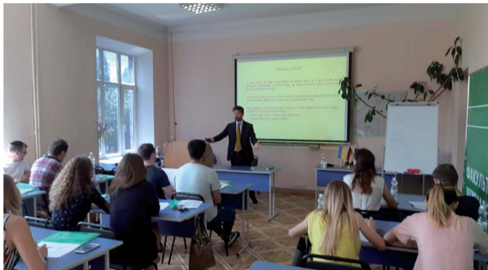
Професор Аксель КІНД під час виступу в КНЕУ

були записані виступи підприємців та їх дискусії з інвесторами, – яку стратегію необхідно вибудувати для переговорів із потенційними вкладниками – тобто обирати для себе оптимальні шляхи співпраці з бізнес-партнерами.