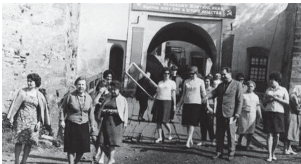
Мукачівська фортеця, квітень 1968

Уявіть собі красивий сонячний ранок, туристичні групи з різних міст розподіляються на екіпажі й по черзі стартують від причалу. Канали місцями зовсім вузькі й неглибокі, тому довгі «пробки» з човнів, впритул один до одного, утворюються постійно. Учасни-