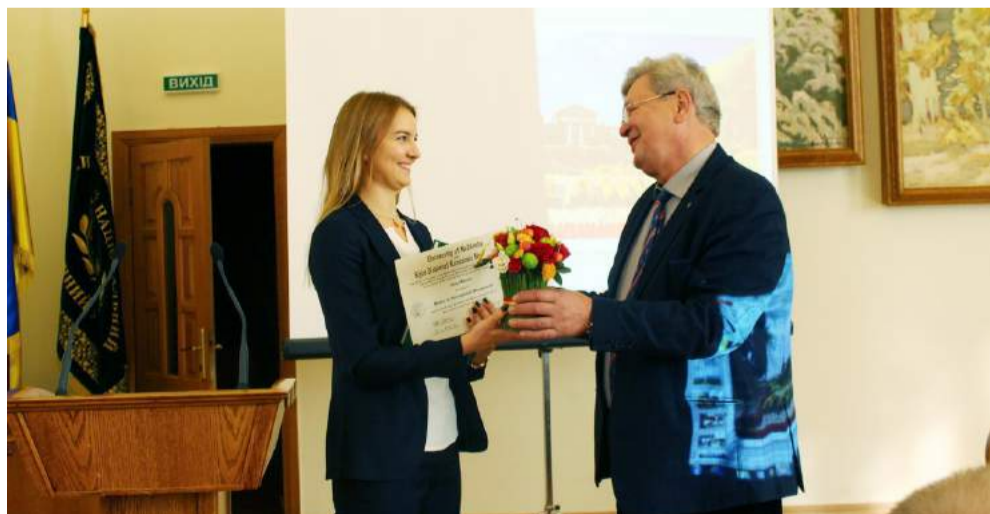
Вручення спільних дипломів студентам англійськомовних програм Магістр ділового адміністрування (MBA) та Магістр міжнародного менеджменту (MIM)

подякував керівництву та викладацькому корпусу університету за якісну освіту та підтримку. Цікавий кейс із професійного життя маркетингологів однієї з відомих міжнародних компаній, став яскравим прикладом необхідності швидкого адаптування в сучасному бізнес-середовищі.