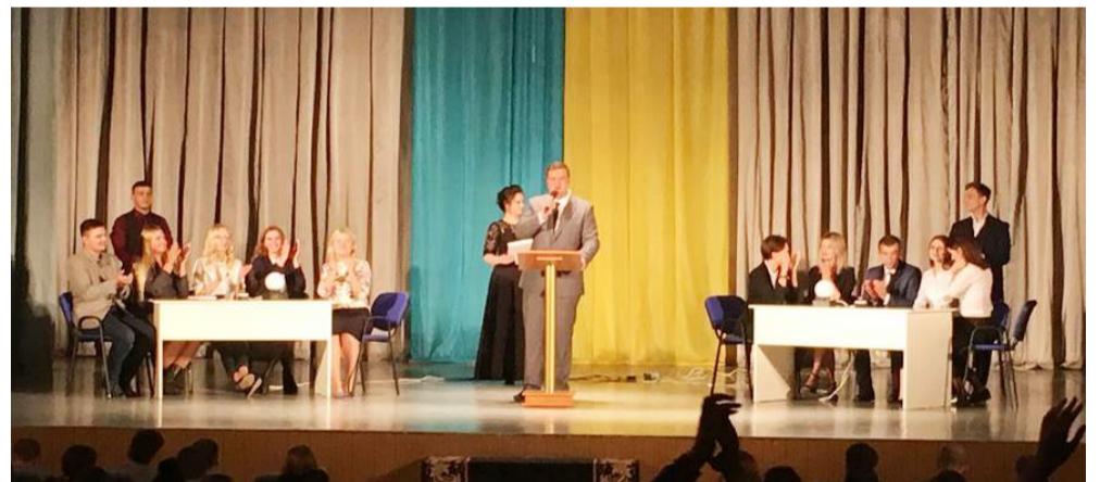
Фінальна гра команд ЮІ КНЕУ «Ad Gloriam» та НАВСУ «Юстиніан»