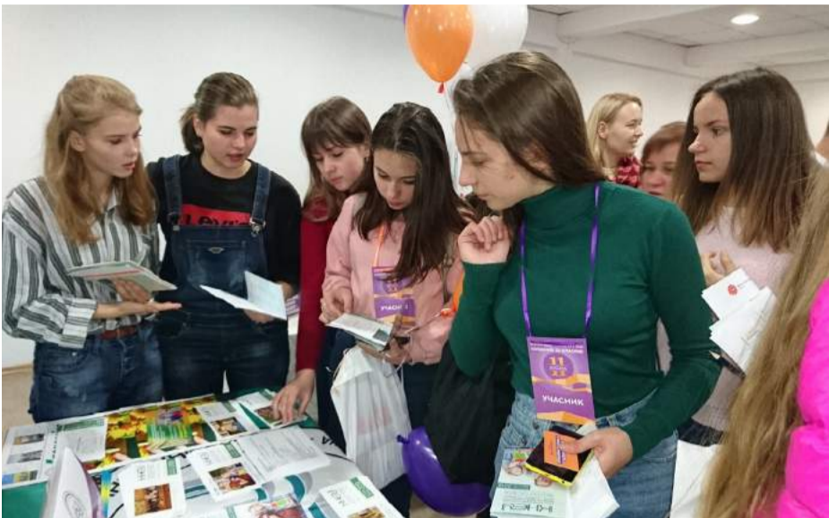
Викладачі та студенти КНЕУ

В 11 класі школярі та ліцеїсти вирішують, який заклад вищої освіти обрати для вступу та як ефективно підготуватися до ЗНО. Близько тридцяти вишів України розмітили свої стенди 13 жовтня у Міжнародному виставковому центрі.