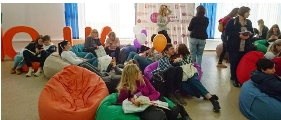
Викладачі та студенти КНЕУ

До речі, уже сьогодні в нашому університеті можна записатися на підготовчі курси до ЗНО з української мови та літератури, англійської мови, математики, історії України й географії. Долучайтеся!