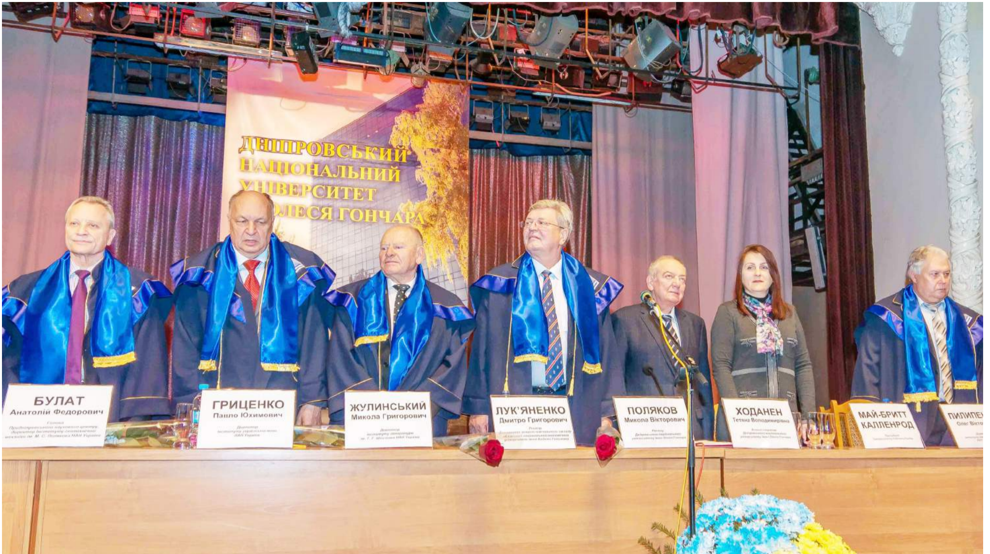
Ректор КНЕУ Дмитро ЛУК'ЯНЕНКО