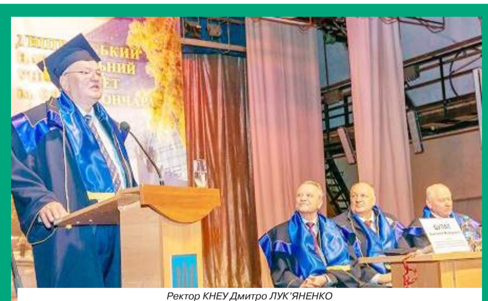
Ректор КНЕУ Дмитро ЛУК'ЯНЕНКО

Ректор КНЕУ Дмитро ЛУК'ЯНЕНКО відтепер почесний доктор Дніпровського національного університету імені Олеся Гончара.