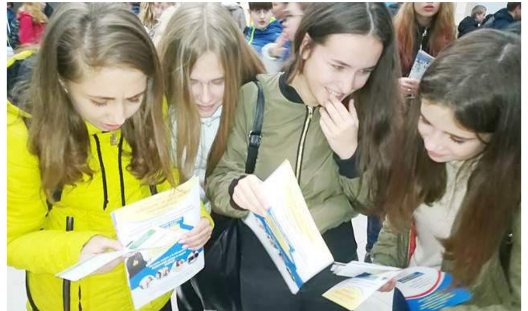
Допитлива учнівська молодь

Традиційним профорієнтаційним маршрутом для нашого університету стало місто Біла Церква.